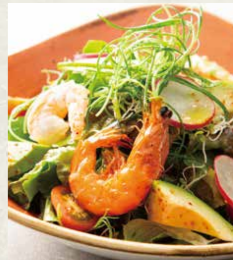
海老とアボカドのメキシカンサラダ