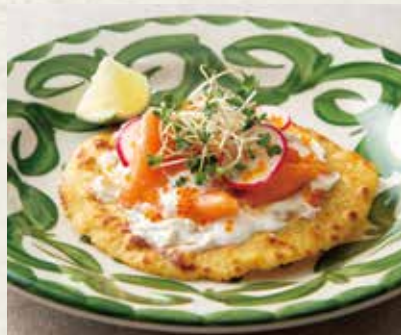
トラウトサーモン&クリームチーズ