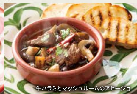
牛ハラミとマッシュルームのアヒージョ

Beef Skirt Steak & Mushrooms Ajillo 1,000 牛ハラミとマッシュルームのアヒージョ