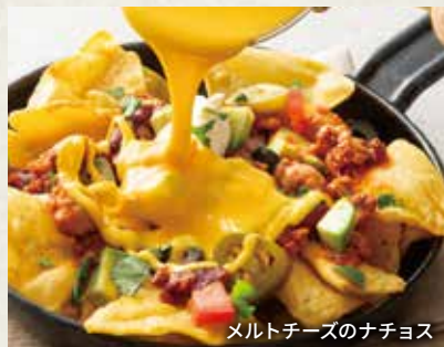
メルトチーズのナチョス