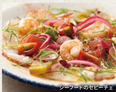
シーフードのセビーチェ