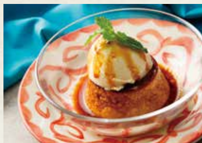
メキシカンフラン ココナッツアイス添え