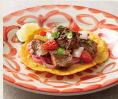
黒毛和牛のカルネアサダ