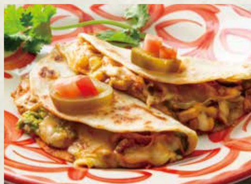
チキンティンガのケサディーヤ

自家製フラワートルティーヤに具材とチーズを挟んでオーブンでグリル。 とろーっとチーズが楽しめるのが「ケサディーヤ」です。