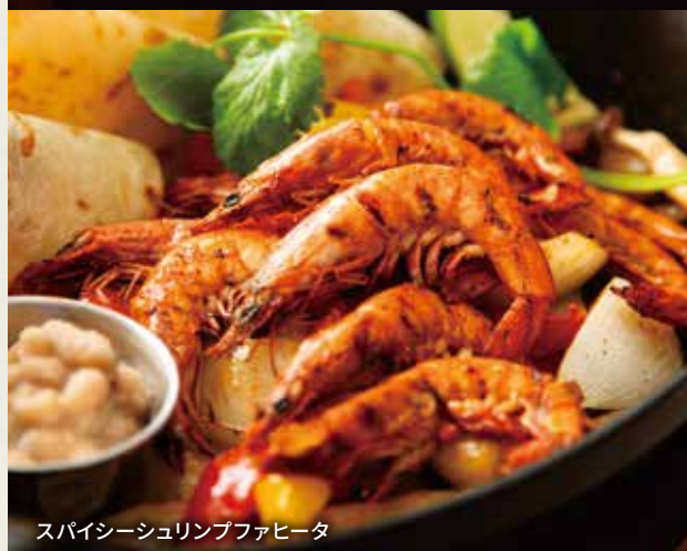
スパイシーシュリンプファヒータ