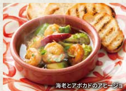
海老とアボカドのアヒージョ