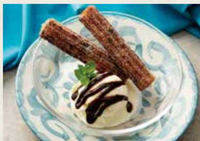
シナモンチュロス ココナッツアイス添え