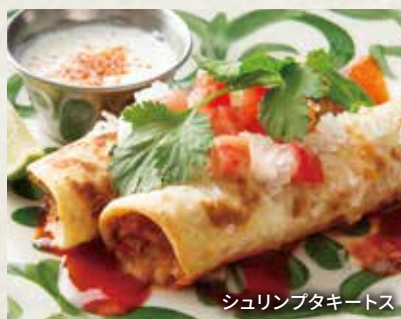
シュリンプタキーツ