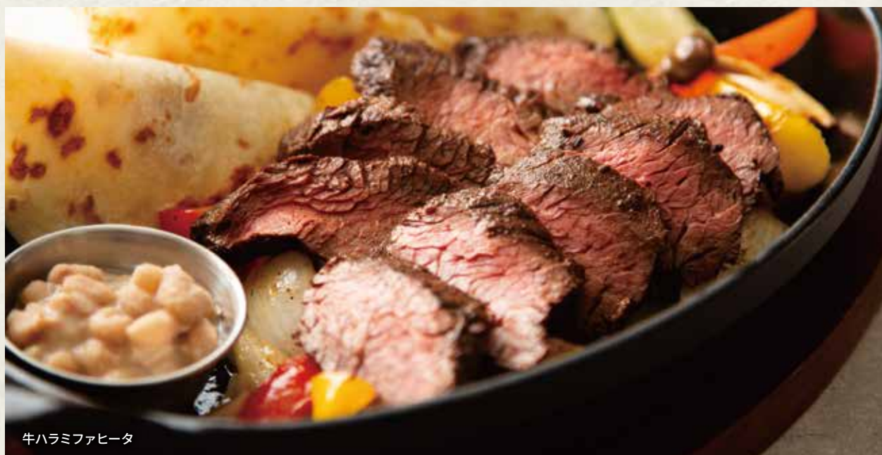
牛ハラミファヒータ