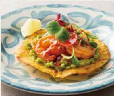
スパイシーシュリンプ